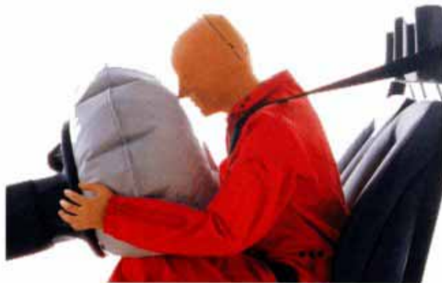
Das Sicherheitsplus für jeden Fahrer: der serienmäßige Audi Fahrer-Airbag.

Sogar der Gepäckraum wurde speziellen Sicherheitstests mit losem Ballast unterzogen, um ein neutrales Verhalten der Rücksitzbank beim Frontalaufprall sicherzustellen. Und ein ganz besonderes Sicherheitsplus für jeden Fahrer ist der serienmäßige Fahrer-Airbag in